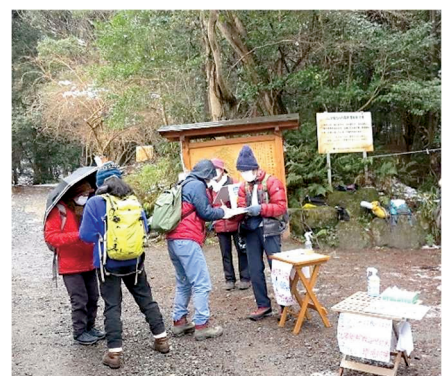
登山口での署名活動

https://www.jwaf.jp/publication/magazine/backnumber/2023/data/no581.pdf