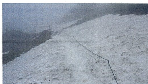
（H22.6.27 オヤマ沢田代上付近ベンチの様子）

なお、至仏山にトイレはありませんので、携帯トイレの携行をお願いします。使用済み携帯トイレのお持ち帰りもお願いします。