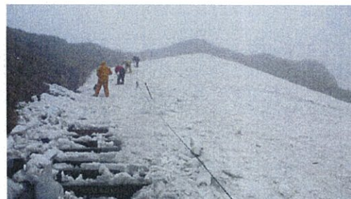
（H22.6.27 小至仏南面の様子）

至仏山保全対策会議 （事務局（財）尾瀬保護財団） tel 027-220-4431