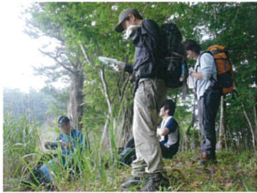
地図を使って山を読む