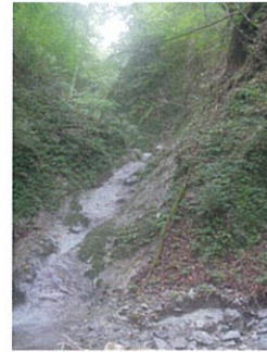
無名ながら滝とナメがなかなかのオツボ沢