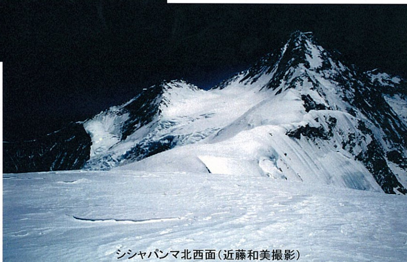
シシャパンマ北西面