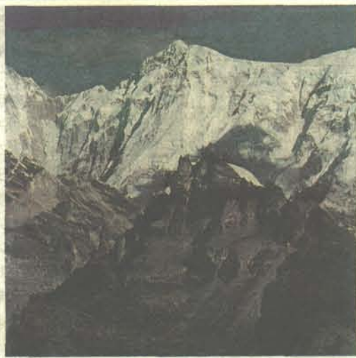
ナンパイゴスム2峰 (ネパール)

日ネ国交50周年を記念して、労山とネパール登山協会とでこの秋、合同登山を行うことで同協会のアン・ツェリン会長と基本合意が出来ていまして、申し込みをお待ちします。時期は9月中旬ではネパール、クーンパは10月下旬の45〜50日間山群の未踏峰、ナンパイです。