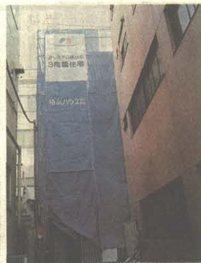
工事中の新事務所

NPO法人住宅問題支援機構理事長からも定期的な報告があり順調に進んでいるとのこと。