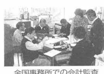
全国事務所での会計監査