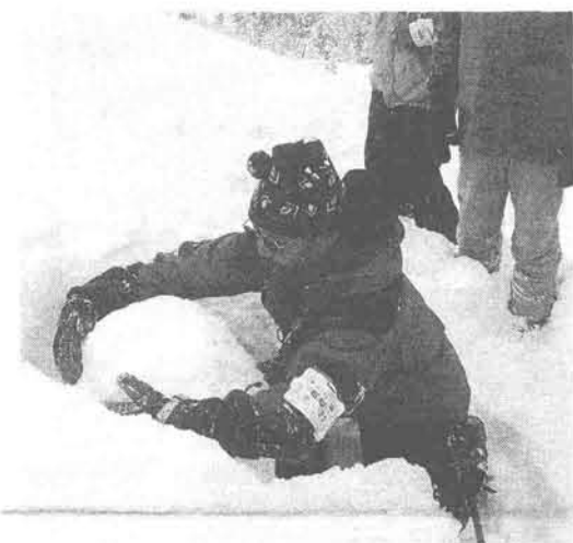
ハンドテスト (山スキー学校)

全国山スキーネットワー クは緩やか、かつ横断的な 組織として、98年5月白馬 連峰は猿倉台地で旗揚げさ れ、来年には早10年目を迎 えようとしている。 目指してきたものは「山 スキーの技術や情報の交 流」「搬出救助技術の普及」 など。これまでシンポジウ ムとして『山スキーの未来 を語る』(99年)、『もうひと つ上の山スキー』(99年)、 『雪崩にどう備えるか?』