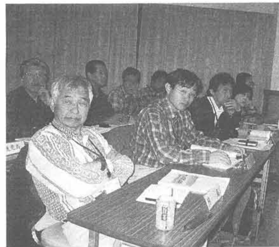
中国・四国選出の評議員

急かつ系統的課題である。そこで、私たちは自らの取り組みの宣言として「自然保護憲章」を制定するとともに、山岳自然と登山者の関係を改めて見直すために、自然保護に対する基本的な認識と考え方をまとめ、あわせて活動の指針とするにしたい。