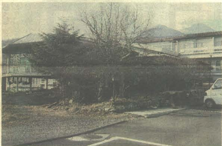
『2005年労山フェスタ』の会場の KOMA VILLAGE

2月20日、東京・晴海 グランドホテルで開催さ れた日本勤労者山岳連盟 の第26期第2回評議会は すべての議案を可決して 無事終了した。 49地方連盟より46名の 評議員と全国連盟役員40 名が出席し、二日間にか わって、活発な討論がさ れ、一部誤記の訂正や表 現の修正提案があった が、ほぼ議案書とおりの 内容が承認された。