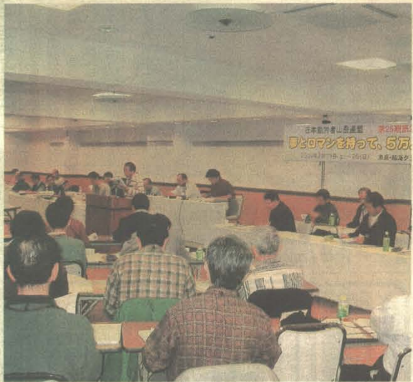
真剣な議論が続く労山全国評議会(東京 2月20日)

組織を強化・拡大するた めにはどのような活動が 必要なのか?のヒントを つかむ機会としたい。