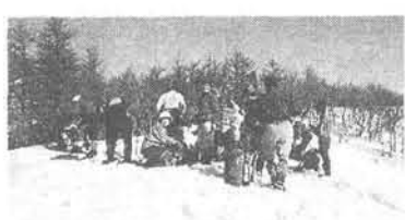
雪の比良山で山行会

例会を毎月20日前後の山 行を取組んでいます。この 冬季も近郊(京都北山・西 山、滋賀県の比良山系等) の山へ雪を求めて、スノー シュー、ワカンを着装しての 楽しい山行を取組んでいま す。雪なんぞカナフンと云 う会員には毎月近畿圏の 「歴史散歩」「古都ウォー ク」シリーズ、里山を歩い て夜は「カニ三昧」のカニ ツアール・雪の白川郷等のん びりと歩ける例会には人気 があり多くの会員の参加が あります。