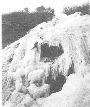
氷瀑 (山梨県/千波ノ滝)