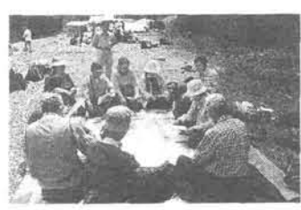
テント講習の実習

世界の屋根カラコルムの 比良山岳センター。/テ マ「事故から学ぶ一技術 アップ交流会」/参加費 6000円/募集人数 50 名/プログラム 搬出訓 練・座学・実技/解散 29 日(日) 12時。 第一回「MFAインストラ クター養成講座」 実施日 6月/場所 関 東MFA指定会場/募集人 員 5~6名/受講資格 登山者。50歳未満。性 別不問。各地方連盟の推薦 者。日赤等の救急法講習会 終了者でCPRを完全にマ スター。資格習得後は各地 方講習会で指導にあたるこ と。/費用15万円(推定) 宿泊代を含む。全国連盟が 受講料の半額負担。/申込 全国連盟連盟対策部。 第11回全国山スキーのつと いのお誘い 11回目を数える今春は、 白馬五竜スキー場から佐野 坂スキー場へ移るコース 「全国山スキーのつと」 は、毎年4月の第1土日に 開催されている。従って今 年は4月2日にこのコース を滑り、その夜に盛大な交 流会が催される。参加費は 1万円を予定。申し込みは 委員会 比良山岳センター。/テ マ「事故から学ぶ一技術 アップ交流会」/参加費 6000円/募集人数 50 名/プログラム 搬出訓 練・座学・実技/解散 29 日(日) 12時。 第一回「MFAインストラ クター養成講座」 実施日 6月/場所 関 東MFA指定会場/募集人 員 5~6名/受講資格 登山者。50歳未満。性 別不問。各地方連盟の推薦 者。日赤等の救急法講習会 終了者でCPRを完全にマ スター。資格習得後は各地 方講習会で指導にあたるこ と。/費用15万円(推定) 宿泊代を含む。全国連盟が 受講料の半額負担。/申込 全国連盟連盟対策部。