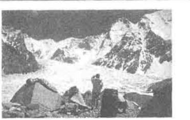
ガッシャーブルムBC

ただ仲間が集まって山へ行 くだけでなく、登山運動と して多くの仲間を増やし、 安全で豊かな山行を繰り返 せる様願っています。 自然保護担当者会議 で近畿が会議 近畿担当者会議 1月15日に近畿ブロック 自然保護担当者会議が京都 で行われた。京都・大阪・ 兵庫・滋賀・奈良・和歌山 から担当者が出席した。 議題は自然保護憲章制定 中間報告の分析と論議。全 国連盟から自然保護委員長 が出席して説明をした。