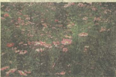
清里高原の秋(山梨山の会 川嶋万里子)