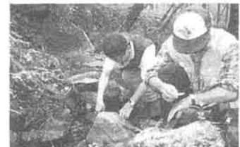
足尾・袈裟丸山 弓の手 コース水場

協会の全国規模の調査に。 栃木県内・近隣県等の37山 域72地点で約160回の検 査をした。また、03年から は水場の周辺環境調査も。 水はヒトの生命、森も植 物もクリーンな水が必要と している。今年も日本トイ レ協会の全国100地点の 調査には協力する予定。