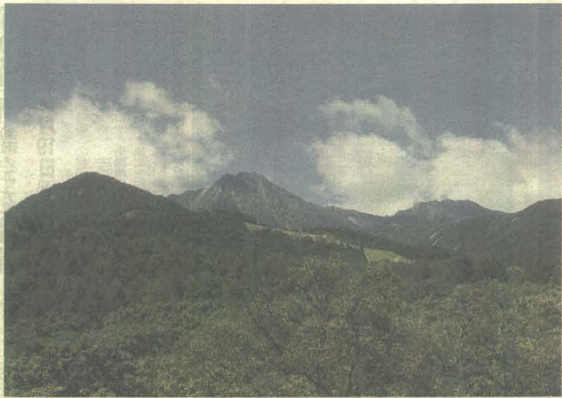
美し森から望む 八ヶ岳主峰の赤岳(中央)と横岳(右)